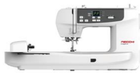
Logica NCH05AX Macchina combinata cucito e ricamo con Wifi