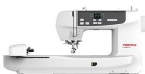
Logica NCH02AX Macchina ricamatrice con Wifi