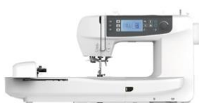
Logica NCH01AX Macchina combinata cucito e ricamo con USB