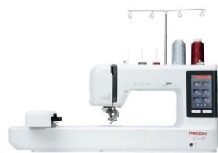
Creator C2000 Macchina combinata cucito e ricamo con Wifi e Cloud